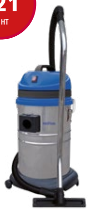
Réf. : 50000420 MAXXI 135 METAL