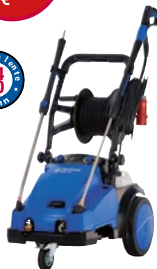
Réf. : 107146774 MC 6P-120/1920 FAXT