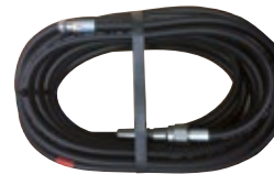
Réf. : FR15005800 FLEXIBLE CANALISATION 20M DN5 AVEC BUSE

Flexible de nettoyage de canalisation 20m DN5, avec buse, usage non intensif, pour NHP types MC 2C/3C/4M