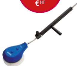
Réf. : 6400018 BROSSE ROTATIVE 055 80CM

Brosse de lavage rotative pour usage intensif, longueur 80cm, pour NHP jusqu'à environ 1000 l/h