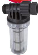
Réf. : 107145802 FILTRE ENTREE EAU 50µ MAX 60°C/2400 L/H

Kit filtre entrée d'eau avec cartouche 50µ - Compatible avec une grande partie des NHP, Raccords en 3/4" F-3/4" M + adaptateur 1/2" F