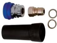
Réf. : 101119496 KIT RACCORDS RAPIDES M+F+ANTI CINTRAGE

Kit raccords rapides Haute Pression avec anticintrage et joints pour raccorder 2 flexibles ensembles, 2 x 3/8" F