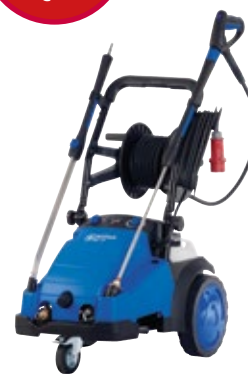
Réf. : 107146801 MC 7P-195/1280 FAXT