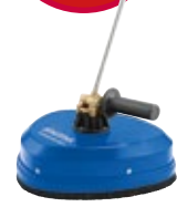
Réf. : 106403187 HYDROSCRUB P300 P + H

Cloche de lavage de sols et murs, D300mm, pour NHP types MC 2C/3C/4M. Livrée avec buses