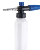
Réf. : 106408234 CANON A MOUSSE VARIO 1 LITRE 0370

Canon à mousse Vario avec dosage réglable de 1 à 10%, angle de jet ajustable de 0° à 65°, pour NHP jusqu'à 660 l/h