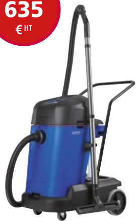
Réf. : 107405167 MAXXI 55-2 WD