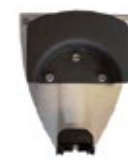
Réf. : 107371029 KIT SUPPORT MURAL FLEXIBLE/LANCE

Kit support murale pour ranger 1 flexible HP, 3 lances et 1 canon à mousse à fixer au mur.