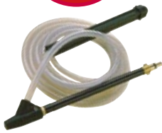
Réf. : 301112493 KIT DE SABLAGE

Kit de sablage complet avec lance et canne plongeuse (4m), usage occasionnel, avec 3 buses de rechange, pour NHP types MC 2C/3C/4M