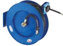
Réf. : 106403131 ENROULEUR MET AUTO FLEX 20M

Kit enrouleur de flexible automatique industriel Haute Pression avec 20m en DN10 double tresse. A fixer au mur. Sans flexible de liaison