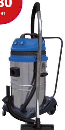
Réf. : 50000421 MAXXI 255 METAL